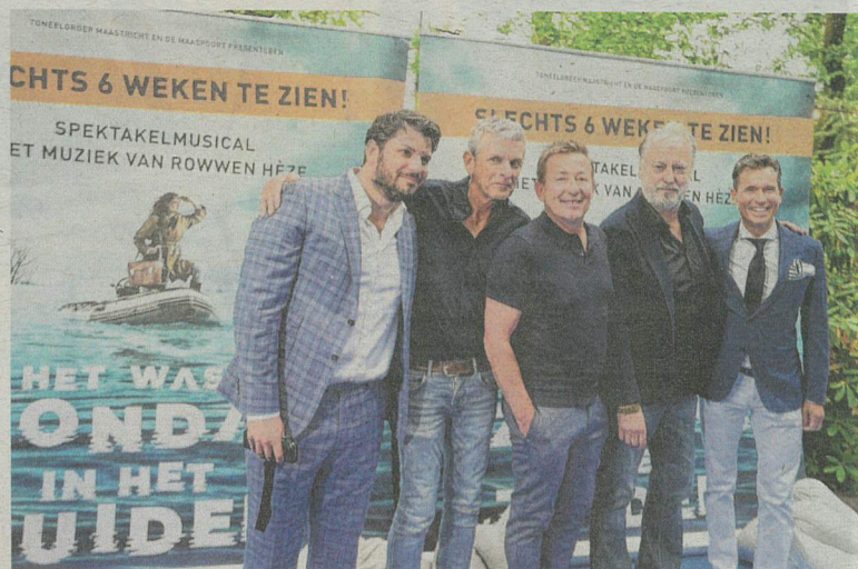
Enkele bandleden van Rowwen Hèze