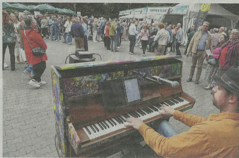
De première zondag van 'Het was Zondag in het Zuiden'.

Toch duurt het wel even voordat de musical onder de huid kruipt. De aanloop is lang, en gek genoeg leidt ook de muziek van Rowwen Hèze aanvankelijk af.